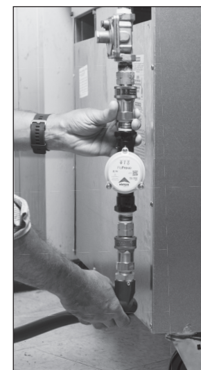
Fig. C Estufa de gas equipada con el nuevo juego FloPro-MD con QD.