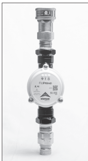
Figure A Mamelon mâle QD installé sur l'extrémité amont et le raccord femelle QD installé à l'extrémité en aval.