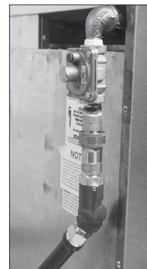
Fig. B Estufa de gas existente con la combinación de manguera Blue Hose QD y Swivel Max.