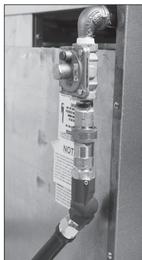
Figure B Cuisinière à gaz existante avec le Blue Hose QD et le raccord Swivel Max.