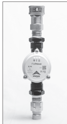
Fig. A QD male nipple installed on the upstream end and QD female coupler installed on the downstream end.