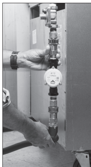
Figure C La cuisinière à gaz équipée du nouveau FloPro-MD avec trousse QD.