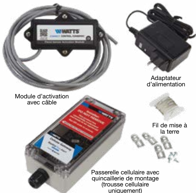
Module d'activation avec câble